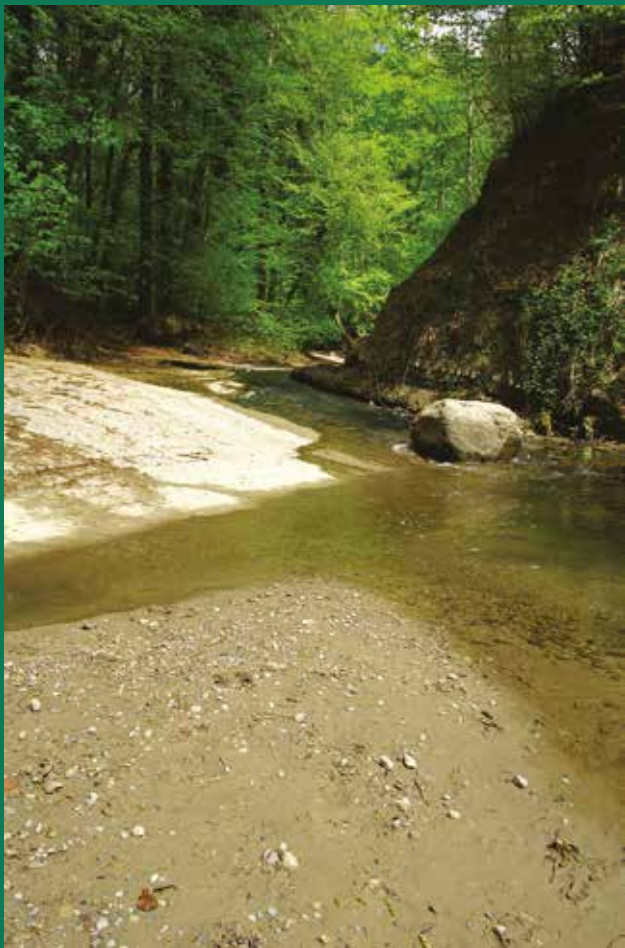
Ambiance romantique au fil de la Mère