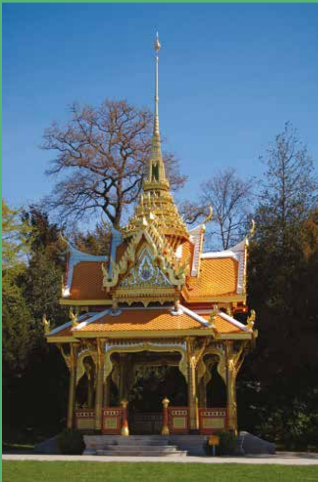
Le Pavillon thaï, au coeur du parc du Denantou