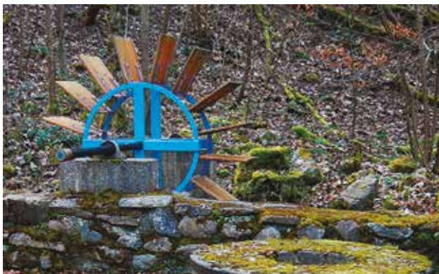
L'ancien moulin matérialisé par cette roue et les anciennes meules

L'existence d'un moulin à cet endroit est attestée par un document conservé datant du 14 e siècle. Les deux pierres au sol sont des meules servant à moudre le grain. Elles sont constituées de grès coquillier, une roche sédimentaire extraite au nord du Canton. Cette région était recouverte il y a fort longtemps de mers avec des coquillages qui se sont fossilisés.