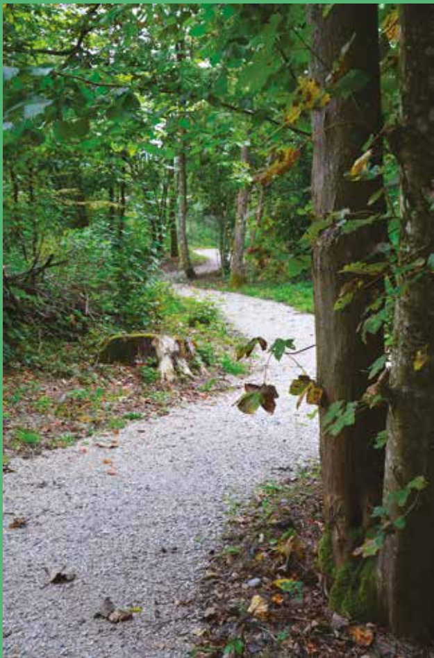
Cheminement en méandres dans le bois de Dorigny