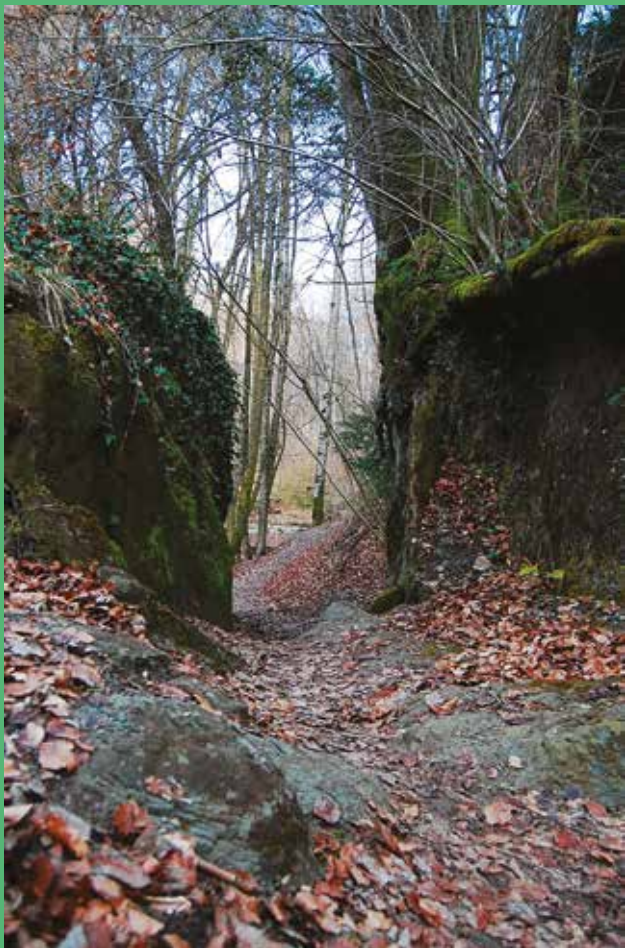
Entre les blocs de molasse