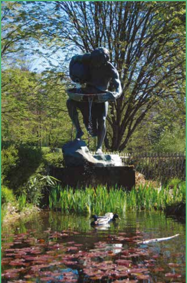
Au cœur du parc du Denantou