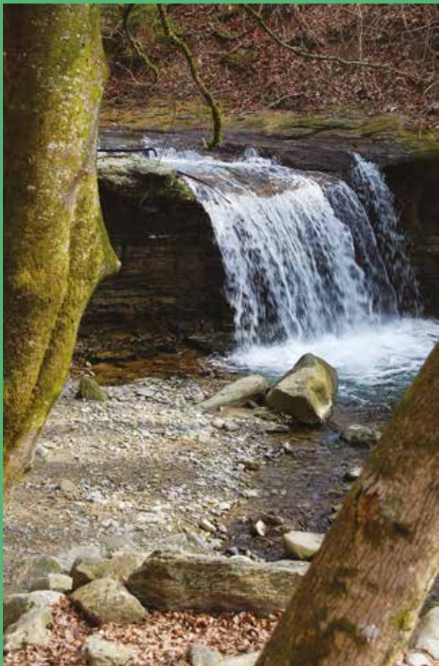
Cascade généreuse sur la Mèbre