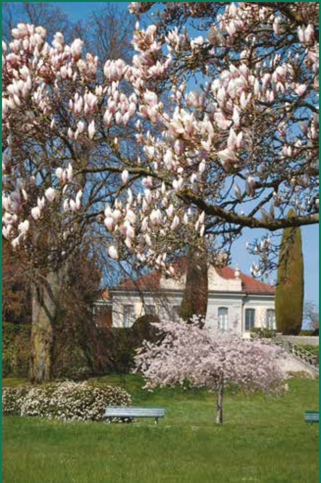
Magnolia et cerisier du Japon en fleur dans la campagne de l'Elysée