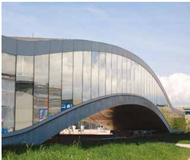
Le Rolex Learning Center, un bâtiment-paysage

Construit en 2010, ce bâtiment tout en ondulation est sûrement l'un des plus intéressants de la région. Une visite à l'intérieur s'impose pour perdre agréablement le Nord au gré des collines. Dépayçant et apaisant!